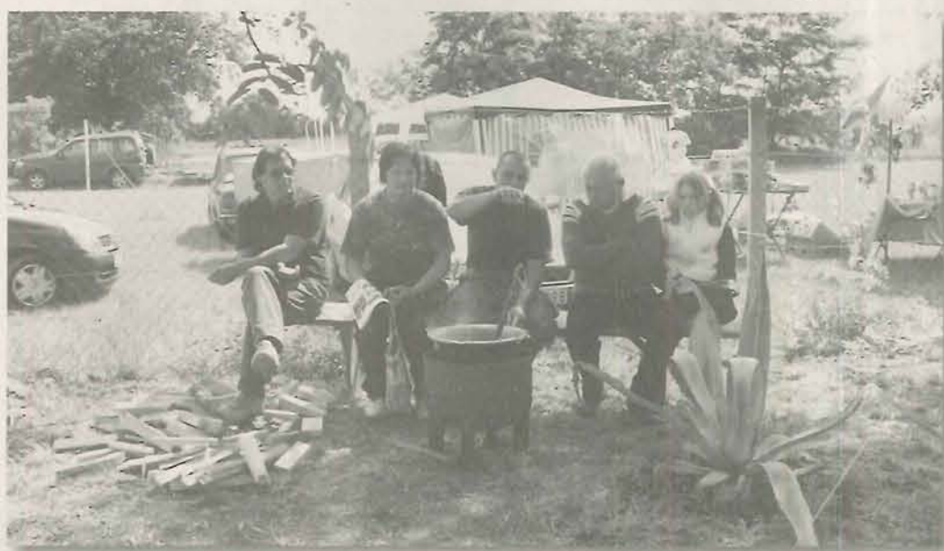
Már rotyog az étel

A gyomaendrői Térségi Szociális Gondozási Központ ellátottai és munkatársai május 30-án részt vettek a VII. Nemzetközi Paprikáskrumpli-főzőversenyen. Három csoport is indult a versenyen és jó helyezéseket értek el a különböző főzési kategóriákban. A főzőhelyek