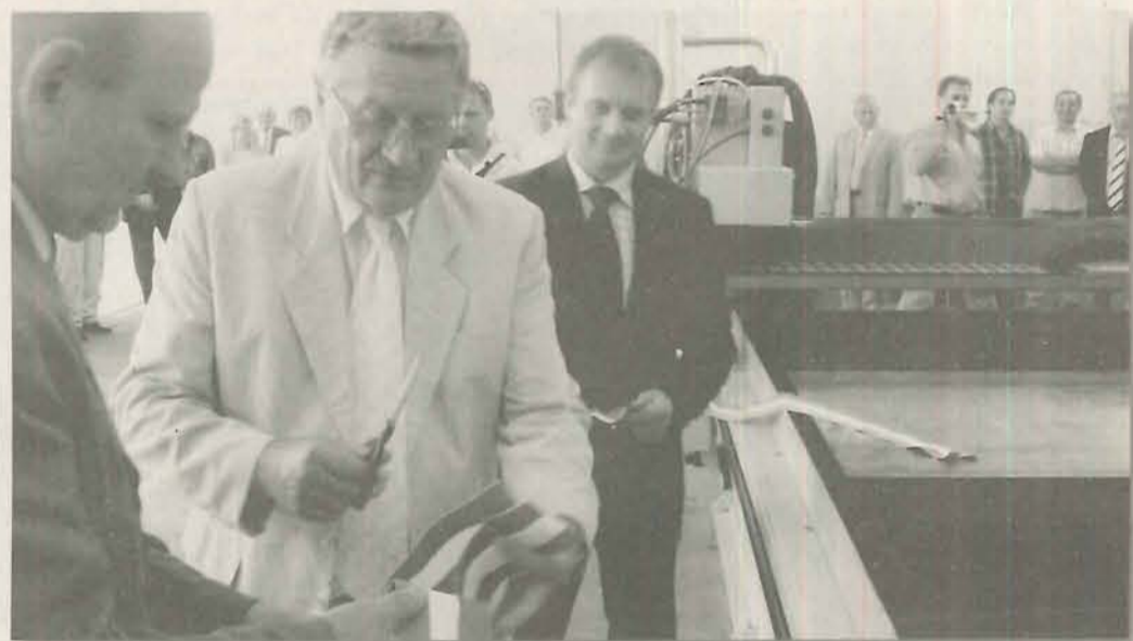
A szalag átvágása hagyományos, a gépsor a legmodernebb

el, hogy mindenképpen fejlesztéseket kell végrehajtani a vállalaton belül, ha a világcégekkel versenyben szeretnénk maradni. Három ütemben szeretnénk volna ezt elérni, először egy korszerű festőüzemet hoztunk létre, második ütemben egy technológiai raktárt valósítottunk meg, a mostani átadással pedig teljesítettük a harmadik lépcsőfokot is, illetve óriásiit léptünk előre a 42 éve piacon lévő vállalat életében” – szölt Winkler János összegzése.