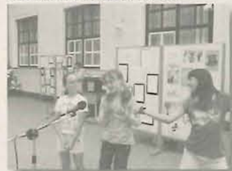
Jókedv a köbön