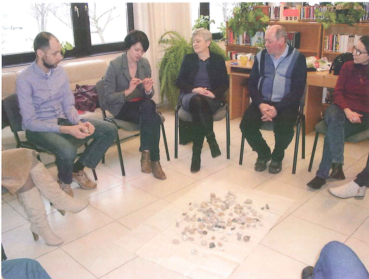
Tréning 1.- Partner kapcsolatok és munkatársak együttműködése - 2017. február 21.