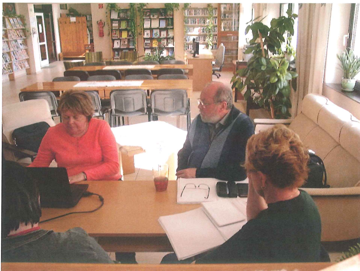
2017. április 4.