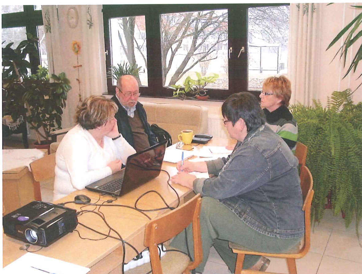
2017. febrúár 14.