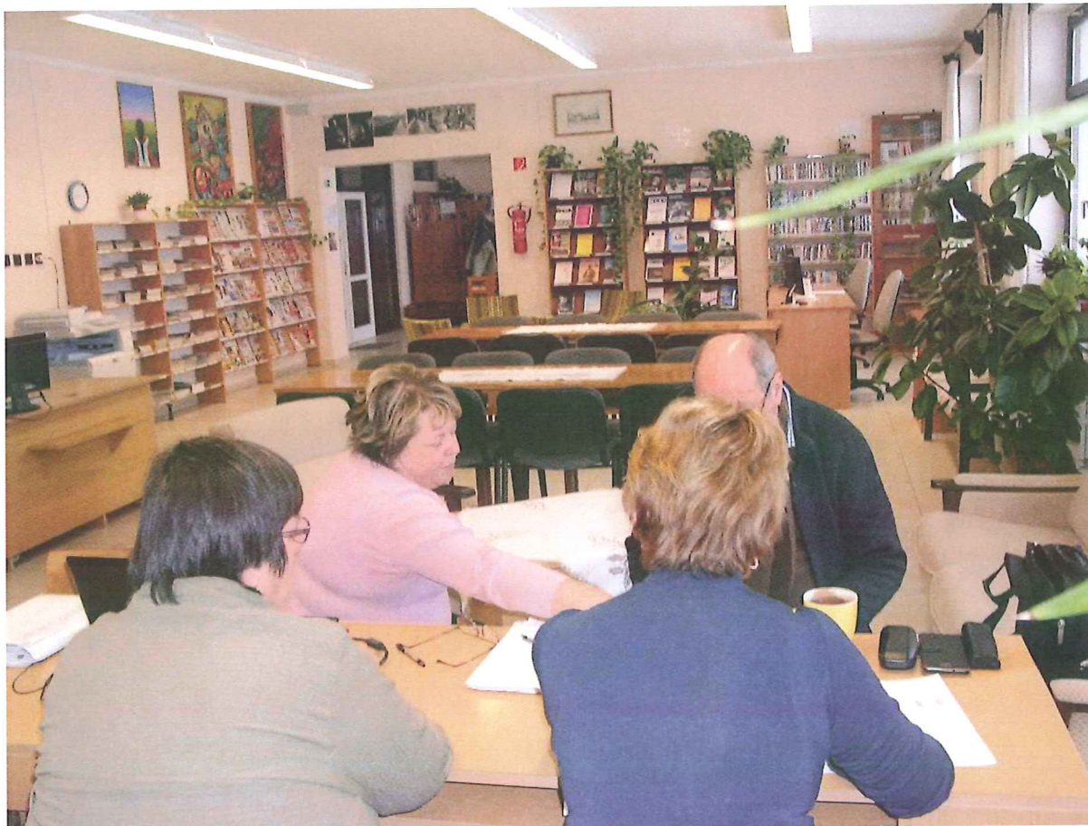
2017. janúár 26.