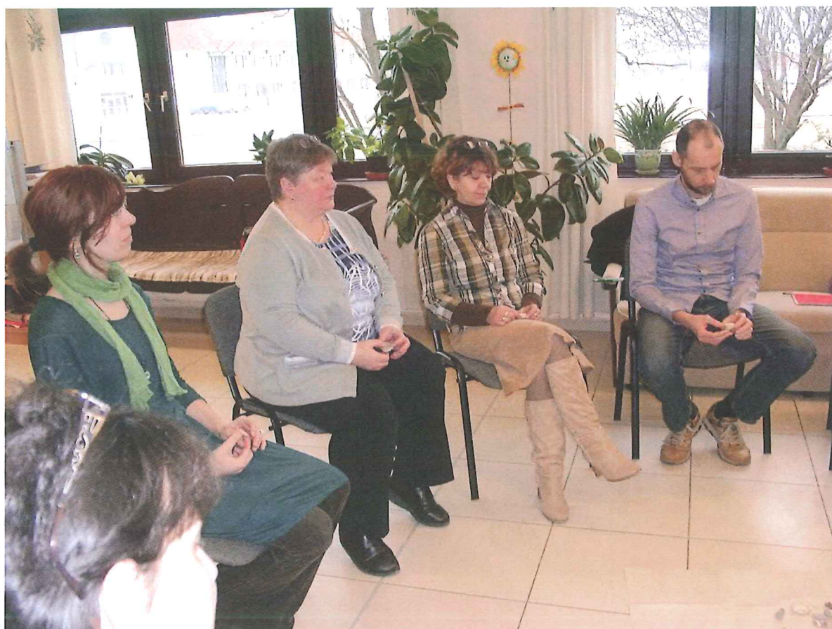
Tréning 2. - Problémás olvasók és kezelésük - 2017. február 21.