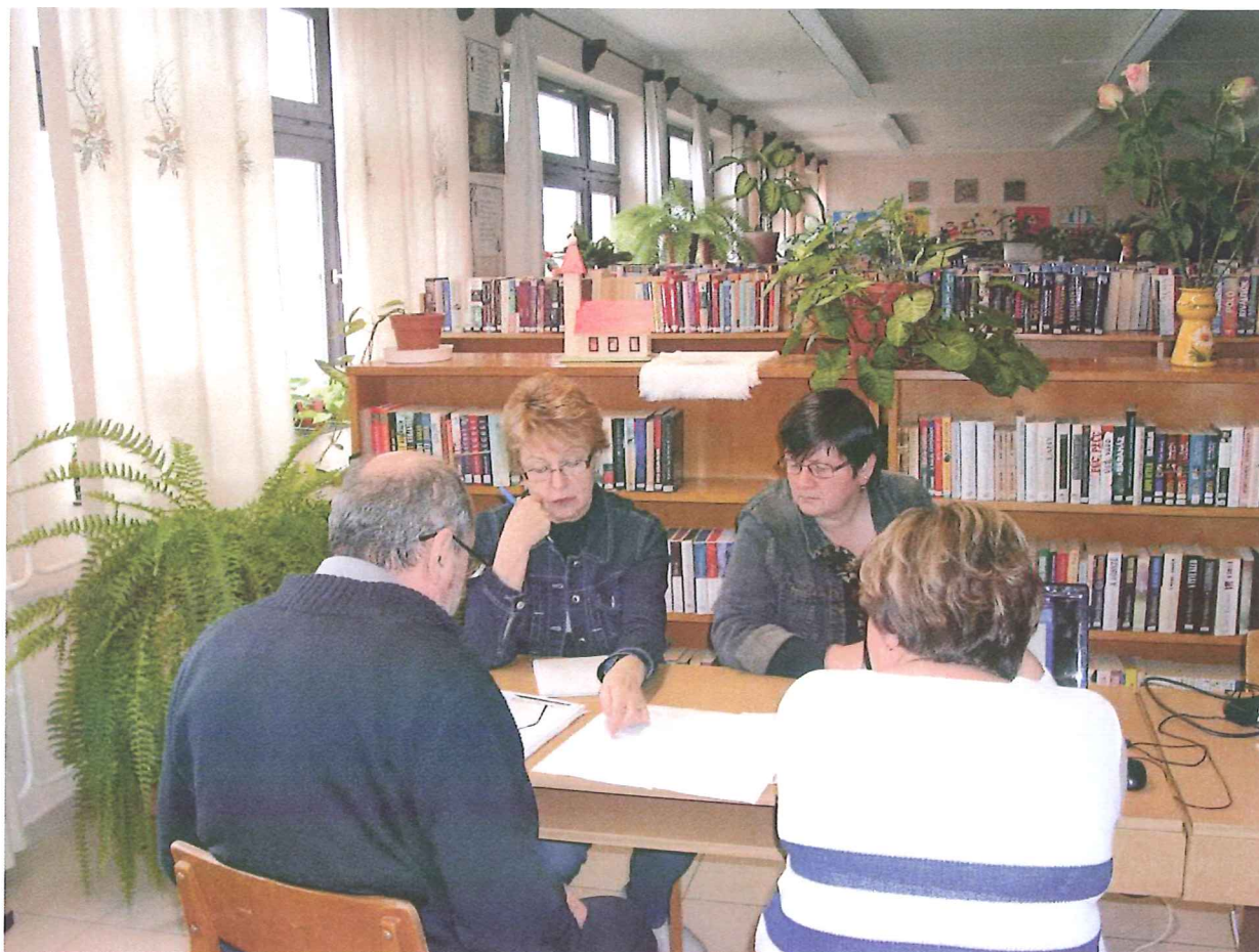
2017. március 9.