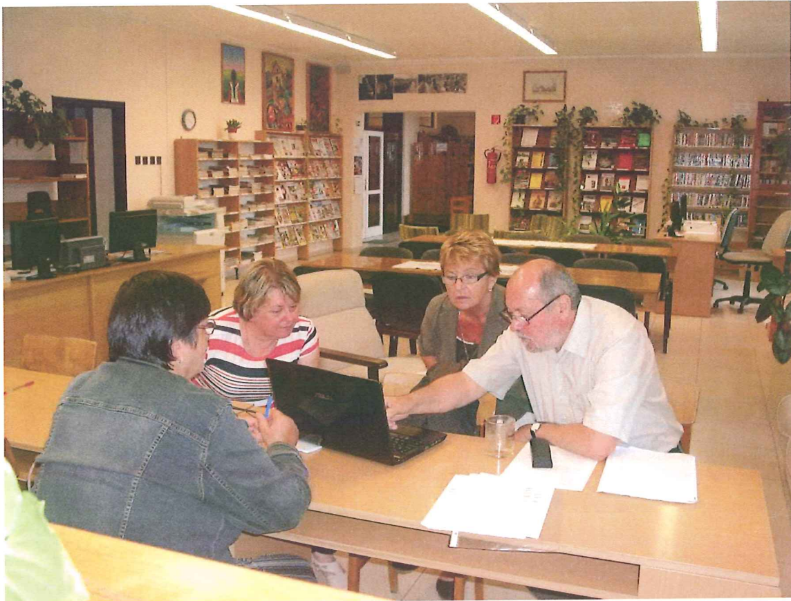
2016. szeptember 6.